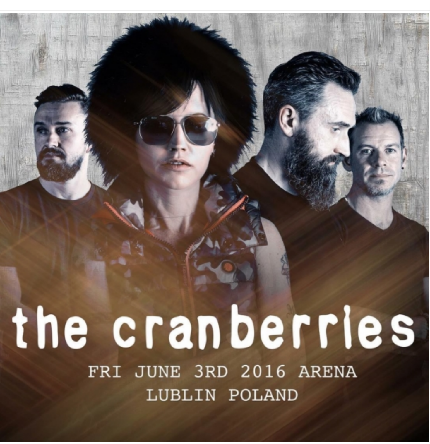
Promocyjne foto koncertu na Instagramie zespołu

Arena Lublin gościła słynną grupę charyzmatycznej Dolores O'Riordan. Polska miała zaszczyt otworzyć ich trasę koncertową, którą zespół powraca 3 latach przerwy.