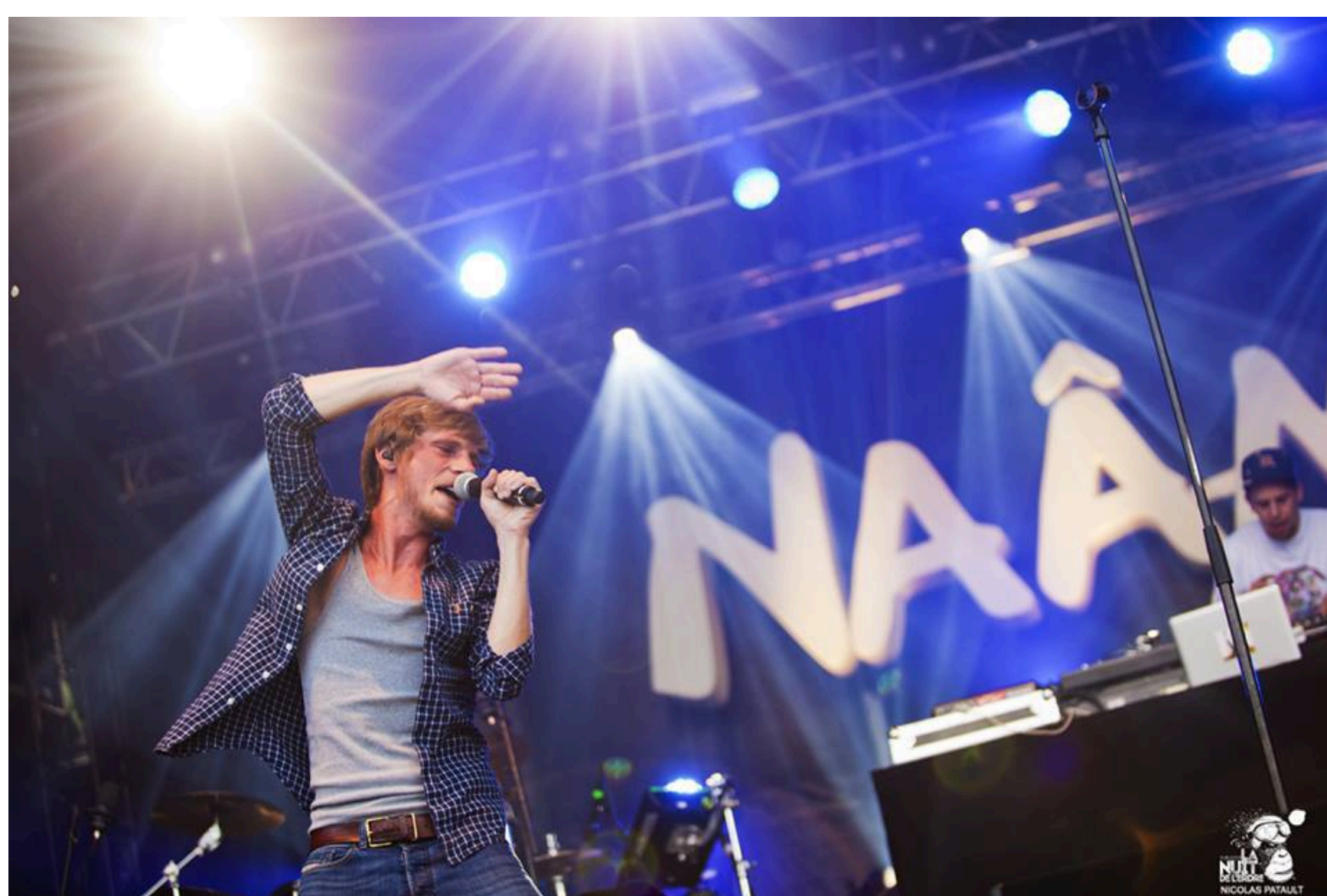
Naáman a fait danser le peuple massé à Nort-sur-Erdre.

Avec le reggae entraînant et exaltant de Naáman, la scène secondaire est une nouvelle fois retournée pendant une heure. La pop singulière de Jeanne Added puis le groupe Synapson – qui a fait venir plusieurs chanteurs sur scène durant sa prestation – font la transition avant le duo Casseurs Flowteurs, désiré par une bonne partie des visiteurs du parc nortais. Une fois en action, les acolytes – omniprésents ces derniers mois dans le paysage culturel – Orelsan et Gringe n'ont pas déçu leurs milliers de fans présents avec leur rap décalé.