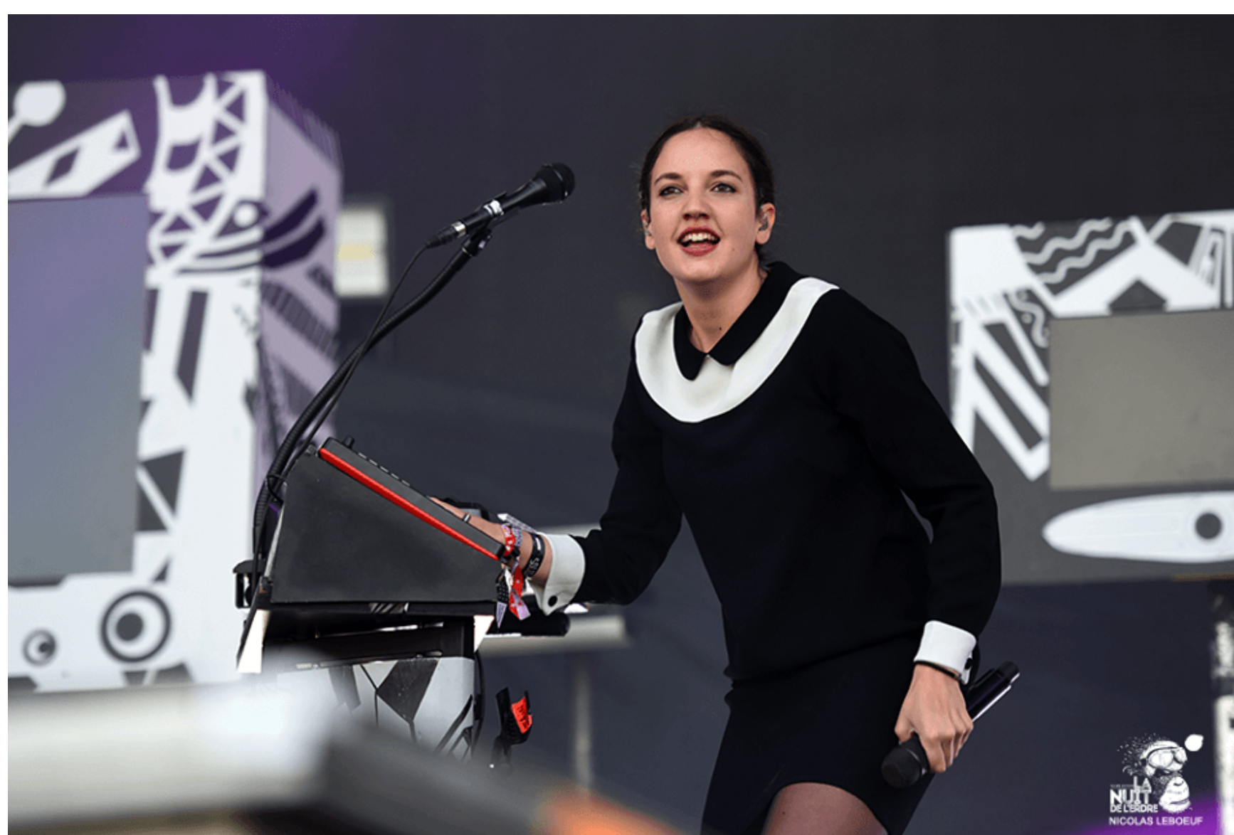
La rafraîchissante Jain a réussi à s'approprier le public, pour offrir l'une des meilleures ambiances du week-end.

Un OVNI investit ensuite la deuxième scène de Port Mulon avec l'autoproclamé inventeur du blues – hip-hop, Scarecrow. Amenant sa fusion rap-rock de Toulouse, le quatuor lance devant la scène 2 le début des pogos , que les Britanniques déjantés de The Temperance Movement, et leur rock originel teinté de blues qui sent bon les racines du genre, vont perpétuer quelques heures plus tard.