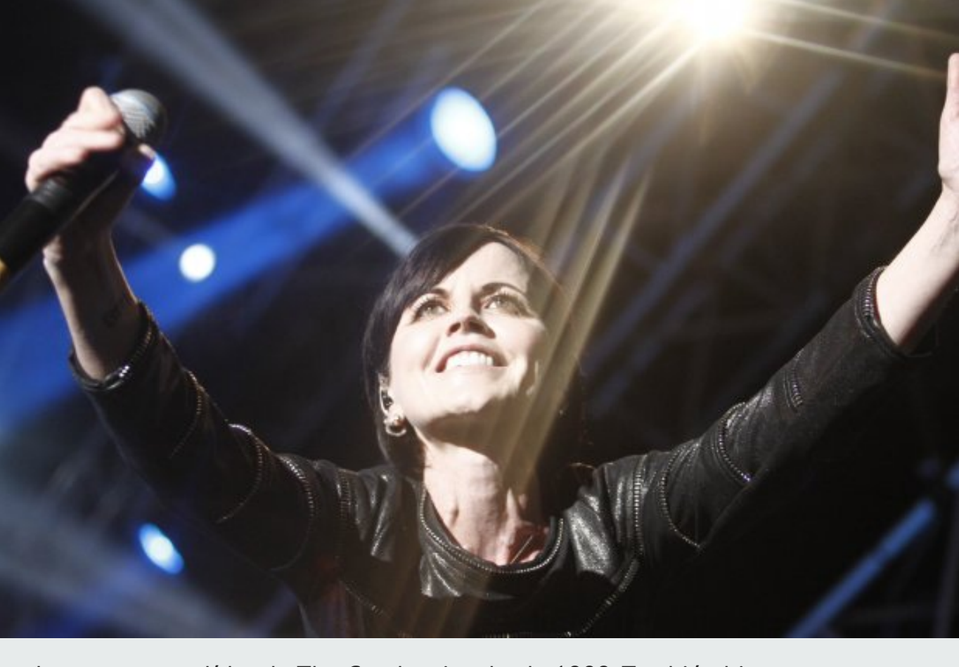
La cantante es líder de The Cranberries desde 1989. También hizo carrera como solista.

Me gusta Compartir 2 Twitter +1 0 Enviar a un amigo