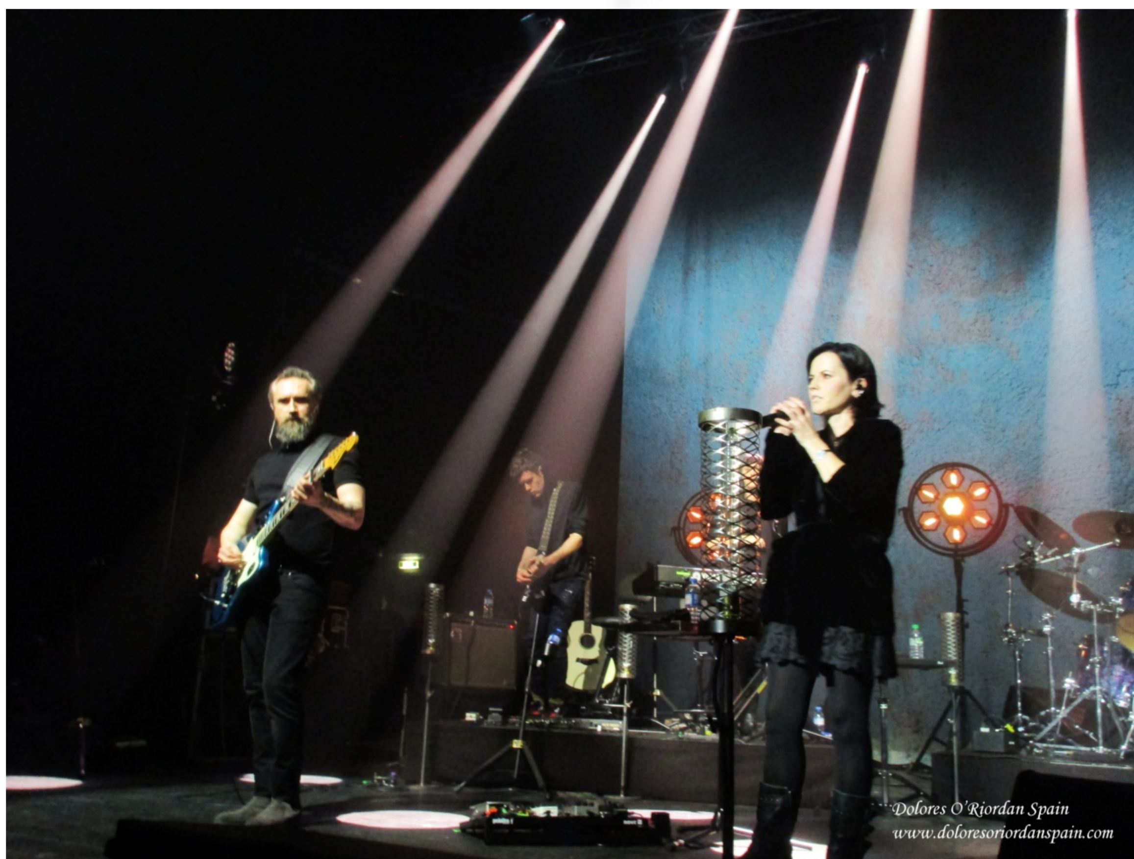
Dolores O'Riordan Spain www.doloresoriordanspain.com

Como si quisiera que su atuendo representase el concepto de Something Else y del formato del concierto, Dolores eligió para la ocasión un elegante vestido de encajes y una chaqueta de terciopelo que contrastaban con sus grandes botas de hebillas. Alrededor de la tercera canción se deshizo de sus botas y continuó el concierto descalza; se movía por el escenario con la libertad con la que se anda por casa. El escenario es su casa, la ha visto crecer. Así pudo moverse a sus anchas por el escenario con temas que hicieron enloquecer a un público entregado y que coreaba sus canciones al unísono: Fue el caso de "Wanted", "Can't be with you", "Zombie" o "Salvation". The Cranberries estaban eufóricos; se veía en la pasión y entrega de Noel; en la sonrisa permanente de Mike, en la complicidad que los músicos mantienen entre ellos, y entre ellos y el público.