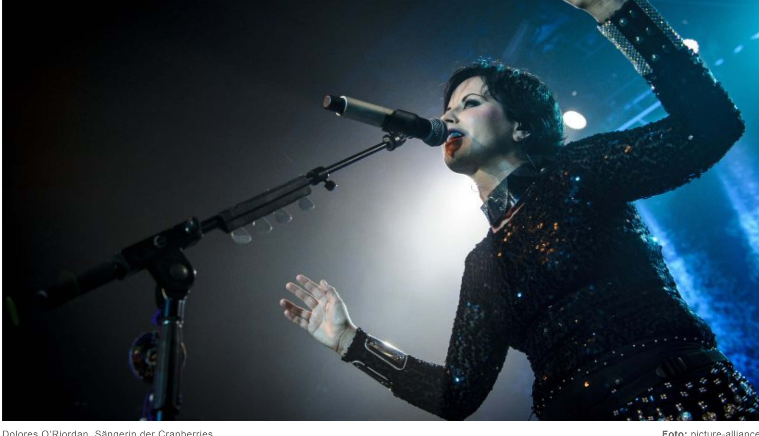
Dolores O'Riordan, Sängerin der Cranberries