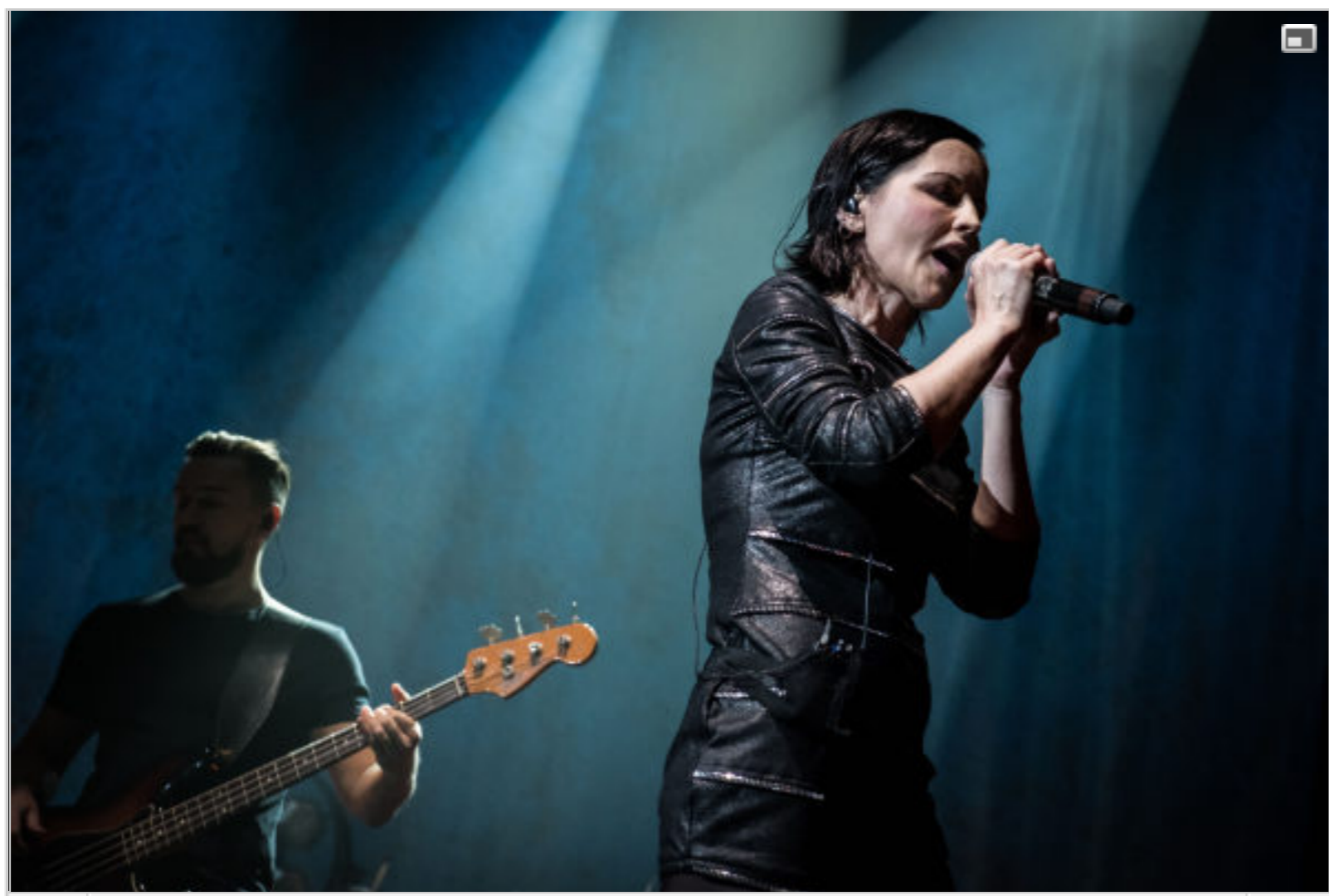
1/22 07.05 Dolores O'Riordan a emmené son groupe devant plus de 2700 fans, dimanche soir.

ESCH-BELVAL - Le groupe de rock irlandais revisitait ses classiques en version réorchestrée, dimanche soir, sur la scène de la Rockhal.