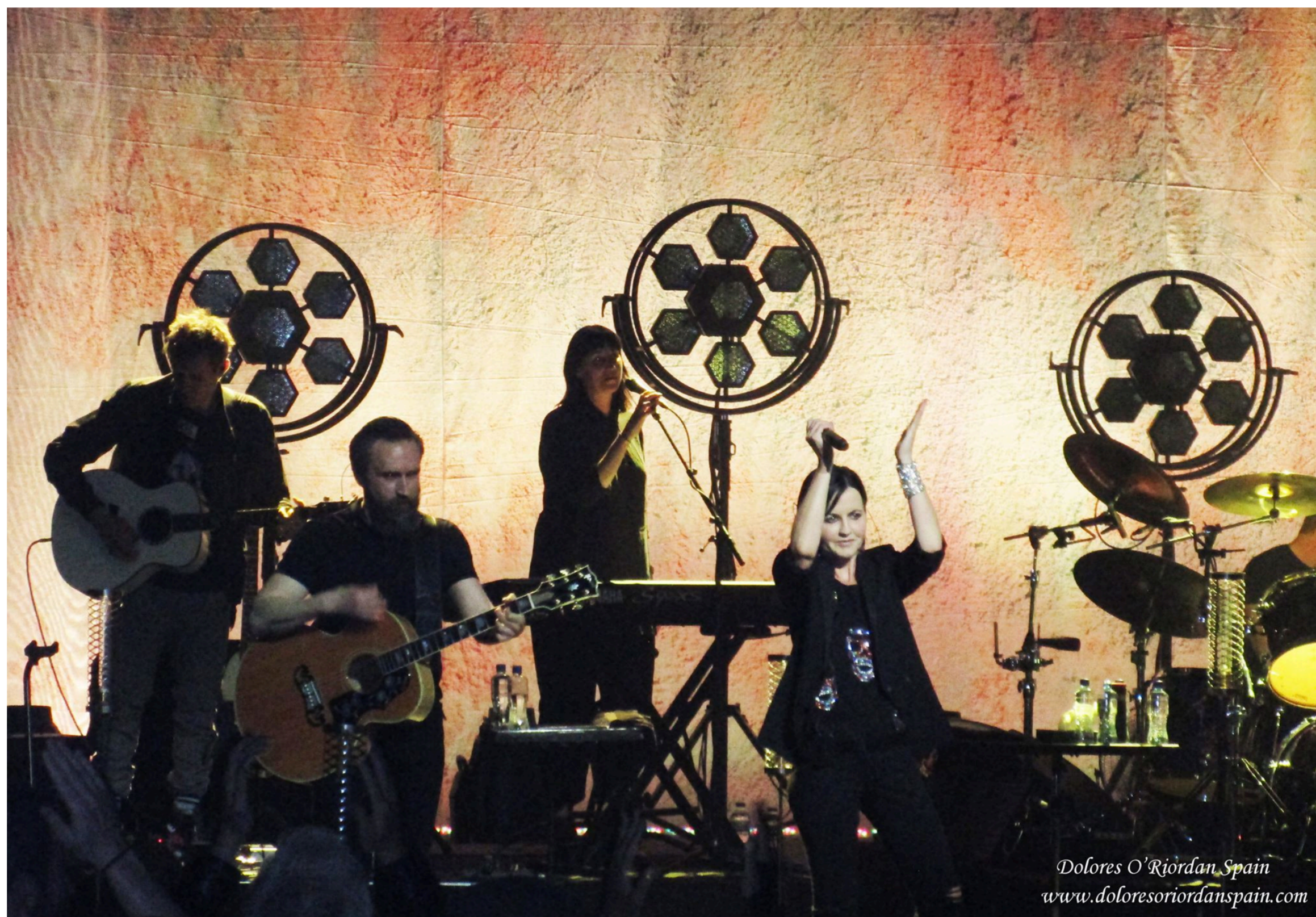
Dolores O'Riordan Spain www.doloresoriordanspain.com

Uno de los problemas de los recintos con butacas es cómo permanecer sentados. Los guardas esperan que lo hagas; la mayoría de los asistentes esperan que lo hagas; pero para los que fuimos niños en los 90, que hemos crecido con The Cranberries y llevamos 10 años girando con ellos: cómo permanecer sentados al estallar esa intro desenfadada de "Salvation", o cuando suena "Desperate Andy" y los pies se te mueven solos; o mientras justo en frente Noel Hogan pone toda la carne en el asador en "Ridiculous Thoughts" . No se pueden contener el headbanging, el pataleo y el taconeo; no somos nosotros, es la música lo que nos mueve. Acabamos por los suelos, bailando de rodillas para no molestar.