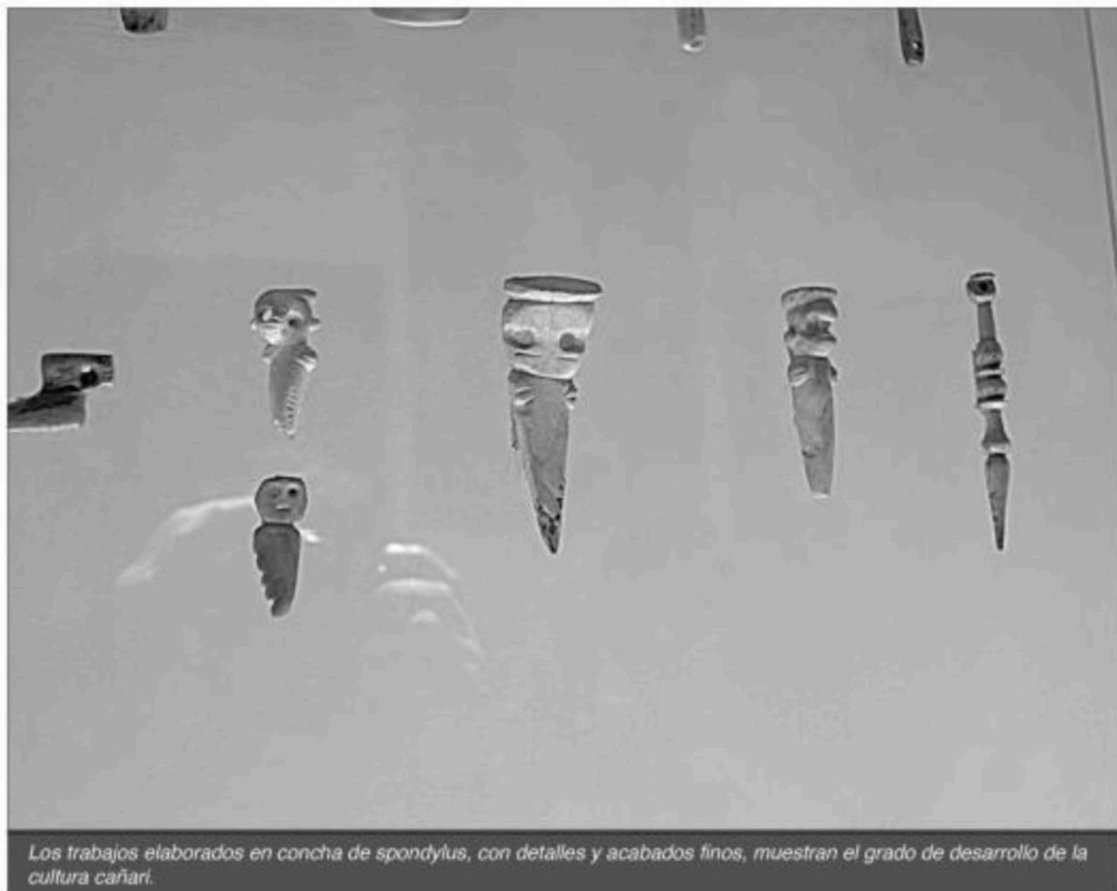
Los trabajos elaborados en concha de spondylus, con detalles y acabados finos, muestran el grado de desarrollo de la cultura cañari.