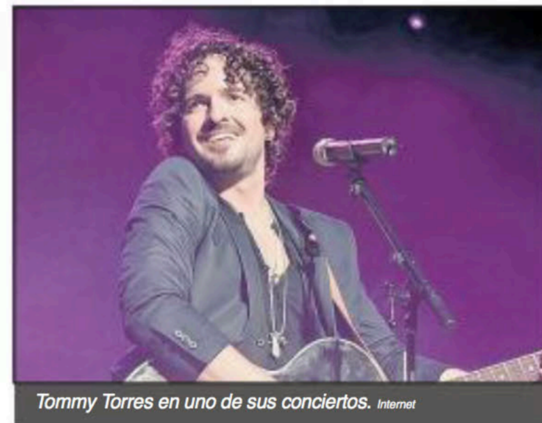
Tommy Torres en uno de sus conciertos.

El cantautor puertorriqueño de 46 años, Tommy Torres, presentó su anunciado tema "Todo me recuerda a ti", canción que en YouTube ya supera las 40 mil visualizaciones.