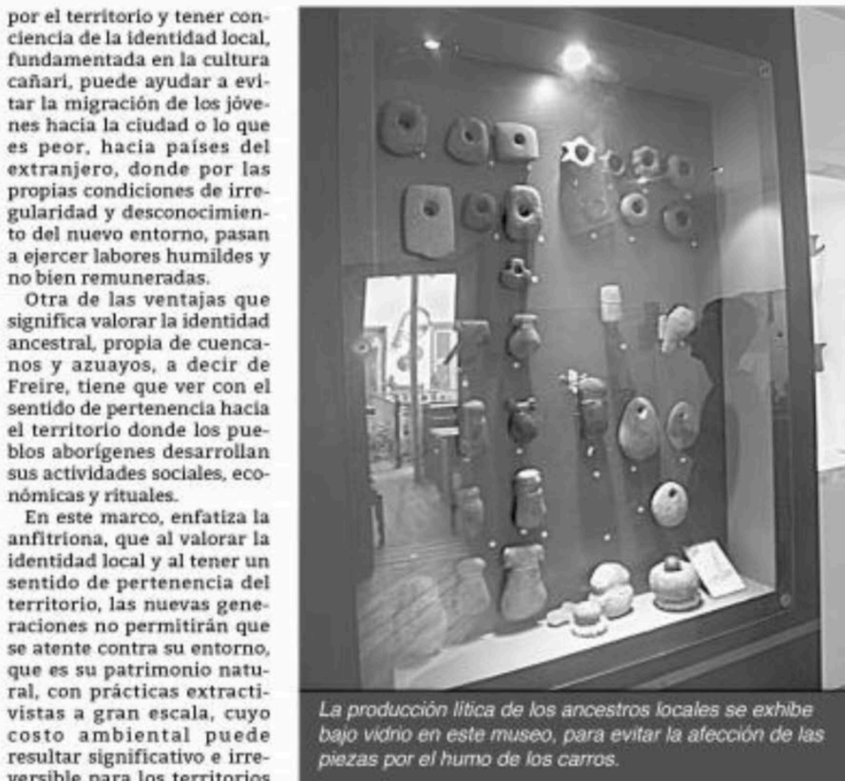
La producción lítica de los ancestros locales se exhibe bajo vidrio en este museo, para evitar la afección de las piezas por el humo de los carros.