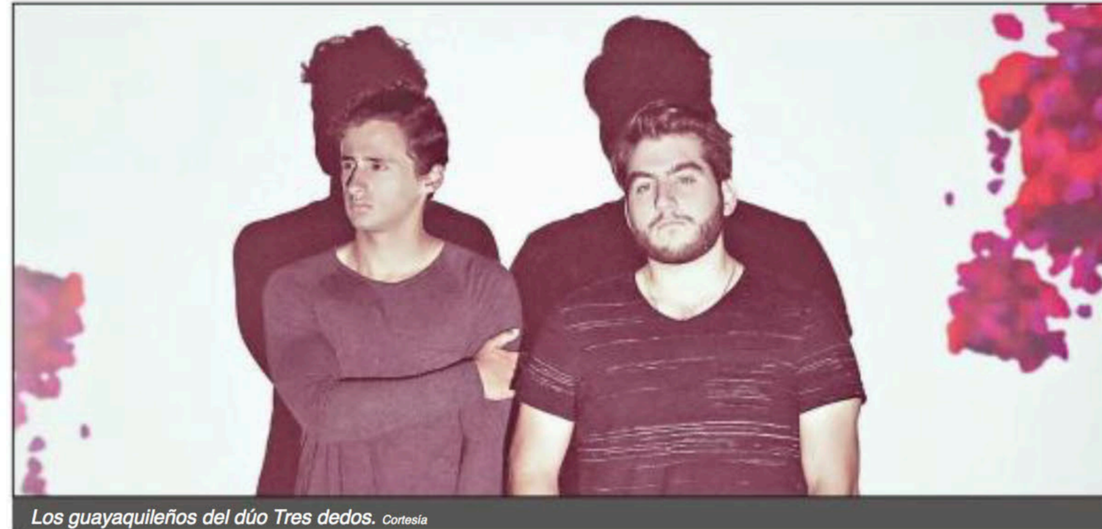
Los guayaquileños del dúo Tres Dedos.

Un nuevo tema que trata de una historia de amor con la que muchos vivirán emociones.