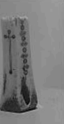
Este "wairo" elaborado en hueso, es una herencia incásica y tiene decorados españoles, se usaba a modo de dado.

La atención al público es de lunes a viernes, en el horario de 09:00 a 13:00 y de 15:00 a 18:00. Los sábados está este espacio que guarda piezas arqueológicas y de arte antiguo, está abierto entre las 09:30 y las 13:00. Adultos pagan 2 dólares, niños 1.