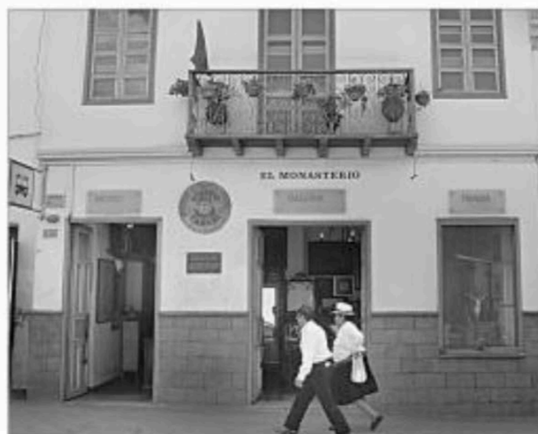
El Monasterio está ubicado en la calle Presidente Córdova 6- 26 y calle Hermano Miguel.