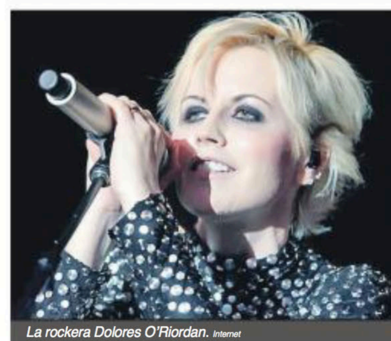
La rockera Dolores O'Riordan.