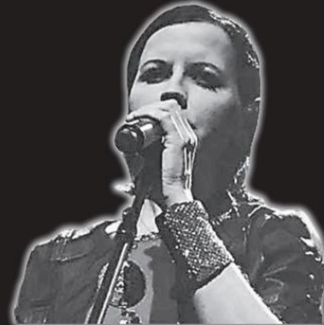
La televisión estatal irlandesa informó este 15 de enero el 2018 del deceso de la cantante Dolores O'Riordan, vocalista de la banda The Cranberries.

La publicación alcanzó en una hora 128 000 reacciones en la red social, más de 50 000 compartidos y más de 11 900 comentarios que, en su mayoría, lamentaron el deceso.