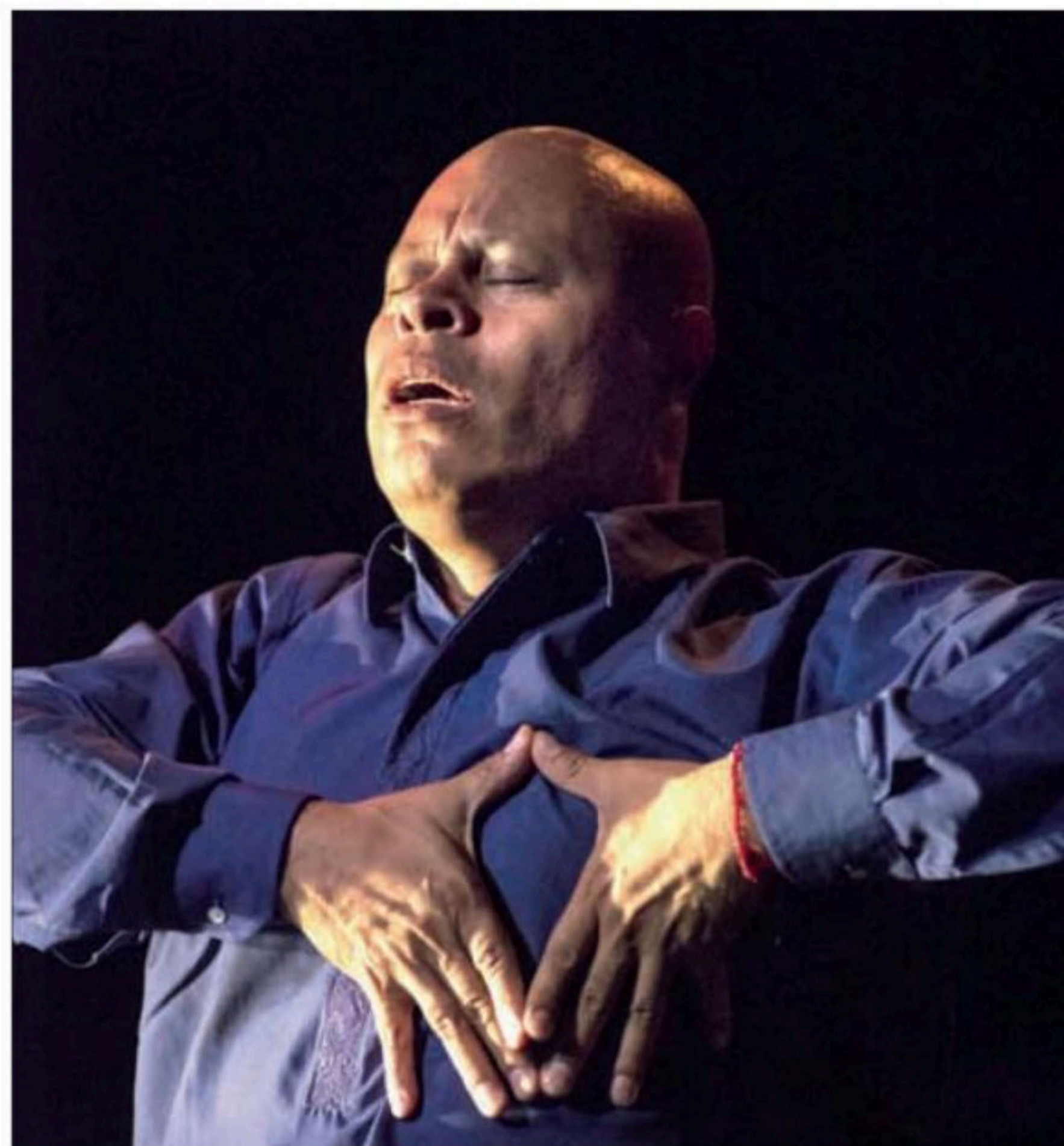
El coreógrafo fundó el año pasado la Compañía de Danza Contemporánea de Acapulco, dirigida a jóvenes de 15 años, la cual no cuenta con recursos gubernamentales

"Los jóvenes han dejado de tener esperanza. Para mí, el arte es un espacio de recuperación de la sociedad y de sanación. Creo que cuando un individuo tiene contacto con el arte, en este caso con la danza, que trabaja con el cuerpo y sus expresiones, esto se magnifica y le permite ser mucho más sensible, mucho más acorde con lo que se está viviendo, y también estar atento sobre cómo aportar y cómo