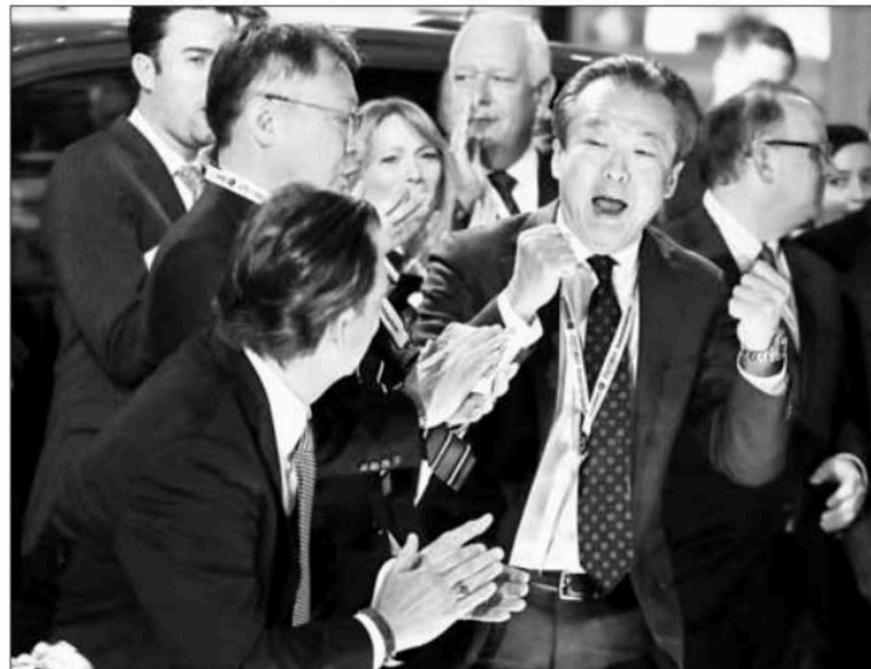
Toshiaki Mikoshiba, director ejecutivo de American Honda Motor Company, celebra que el vehículo Accord fuera declarado el auto del año en el Salón del Automóvil de Detroit

La planta de ensamblaje de GM en Silao, corazón automotor de México, produjo más de 400 mil camionetas en 2017 y es pi-