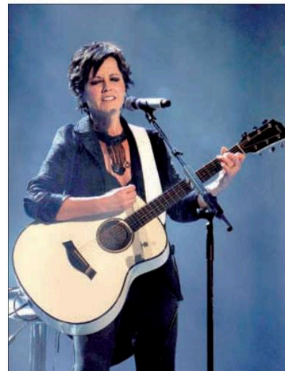
Arriba, Dolores O'Riordan (primer plano), seguida de Mike Hogan, Fergal Lawler y Noel Hogan, el 18 de enero de 2012, en París. Abajo, el 28 de julio de 2011, en Pekín

mos temas para que la gente se entere de lo que pasa en el mundo; sabemos que con una canción no se cambia al mundo, pero es nuestra contribución para transformar algo... No nos preocupamos por estar vigentes, no somos una banda de moda".