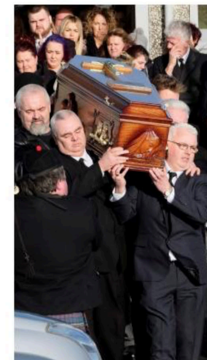
Cuando su féretro salió de la iglesia se escuchó de fondo la canción de The Cranberries "When you're gone" /EFE

130 MILLONES DE DISCOS ha vendido en todo el mundo