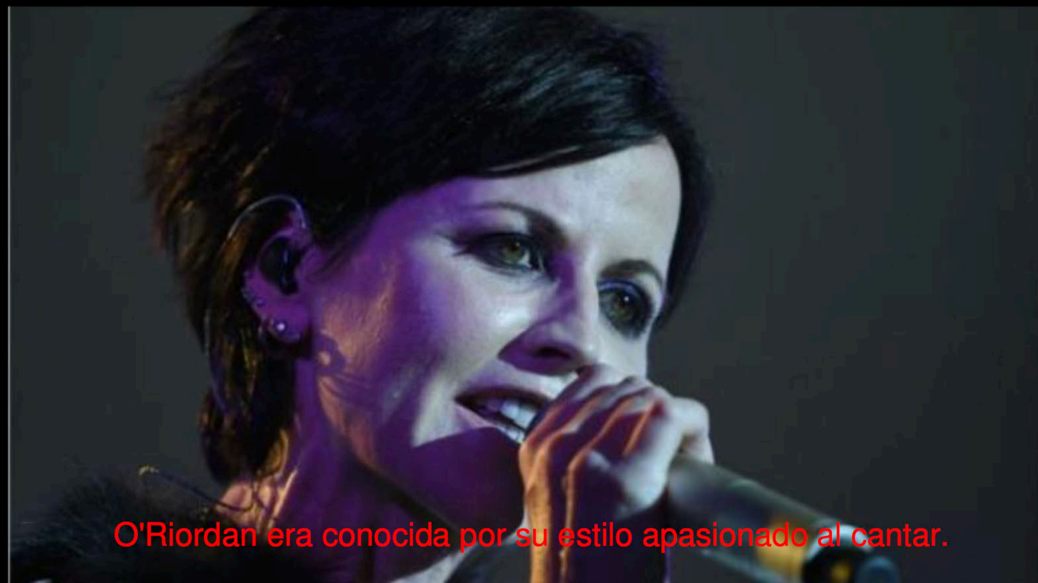
O'Riordan era conocida por su estilo apasionado al cantar.

Un portavoz de la Policía Metropolitana de Londres informó que recibieron una llamada a las 09:05 GMT del lunes desde un hotel en Park Lane, en el centro de Londres, donde "una mujer de alrededor de 40 años" fue declarada muerta.