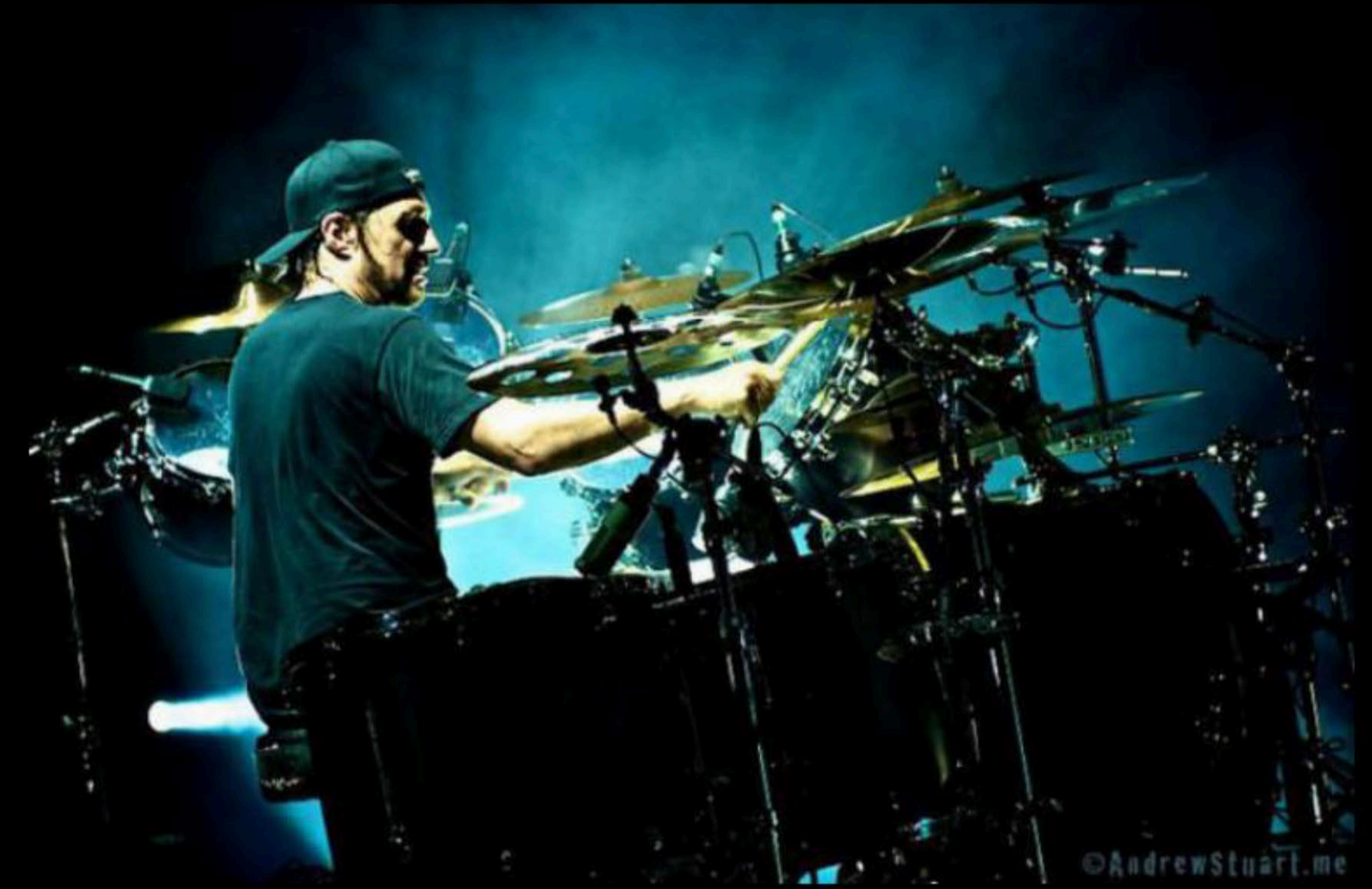
El baterista cubano Dave Lombardo.

El video, que hoy tiene casi 700 millones de visitas en YouTube fue dirigido por Samuel Bayer, quien también dirigió el video Smells Like Teen Spirit de Nirvana.