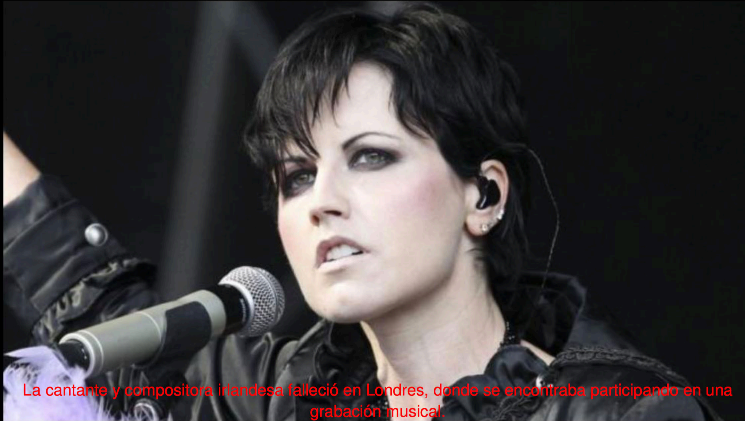
La cantante y compositora irlandesa falleció en Londres, donde se encontraba participando en una grabación musical.