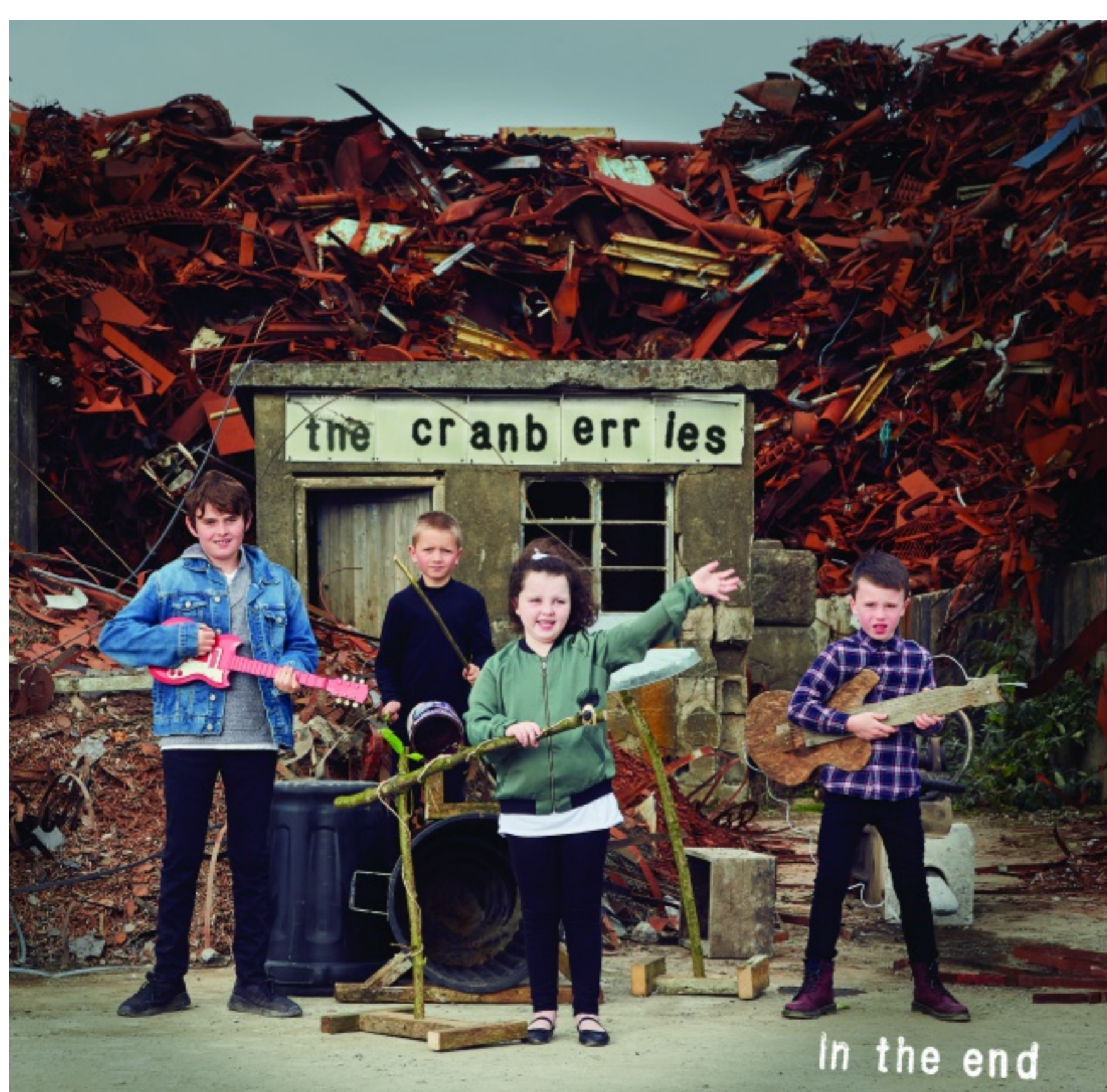
El último disco de The Cranberries / In the end

Y si te gustan los Cranberries de siempre, no puedes perderte Catch me if you can . Otro de los temas de Dolores que Noel recibió en forma de demo y que "al trabajar en él fue adquiriendo un sonido muy Cranberries. Al final decidimos añadirle una sección de cuerdas". Y sorpresa, los músicos son los mismos que tocaron en hits como Linger y Ode to my family . Wake me when it's over , refleja el estilo y personalidad de Dolores como compositora, con su enorme estribillo al estilo de Zombie . "Nos encantó cuando la escuchamos porque estábamos seguros de que se podría convertir en un gran himno de la banda".