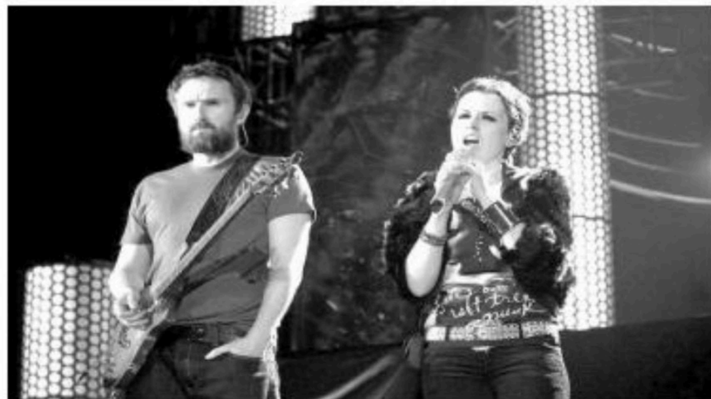
EL SAUVAGE PARTNERS

Antes de su muerte O'Riordan dejó grabadas bastantes pistas vocales, sesiones de grabación en las que trabajaba cuando ocurrió el deceso.