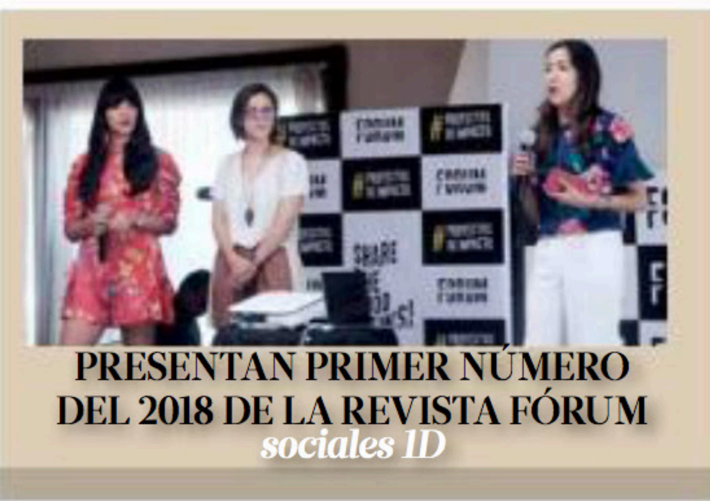
PRESENTAN PRIMER NÚMERO DEL 2018 DE LA REVISTA FÓRUM sociales ID