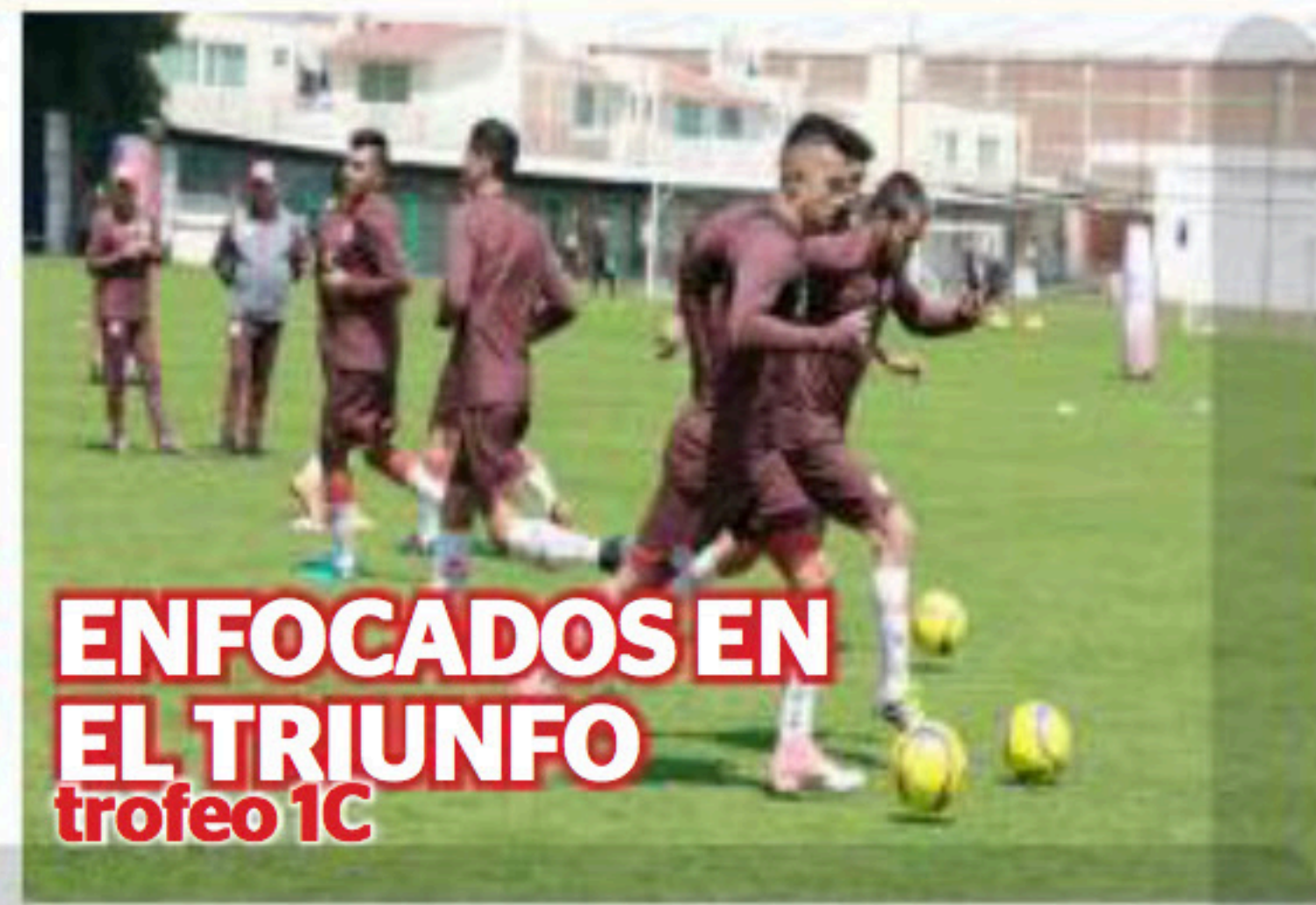
ENFOCADOS EN EL TRIUNFO trofeo 1C