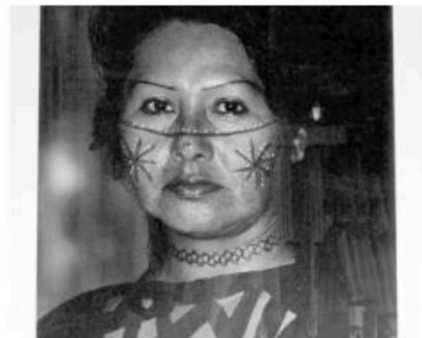
SECRETARÍA DE CULTURA

La belleza de la indumentaria que portan y confeccionan las mujeres de esta región del país, se complementa con fotografías del archivo gráfico del Museo, producto de la lente de Walter Reuter y George Jackson Jr. quienes retrataron además de costumbres y tradiciones, rituales y otras expresiones culturales de los seris, raramuris, kikapoos, tepahuanos, yaquis, mayos, cucapás y kumiai, habitantes de los estados de Sonora, Chihuahua, Coahuila, Nuevo León, Tamaulipas, Sinaloa, Durango, Baja California y Baja California Sur.