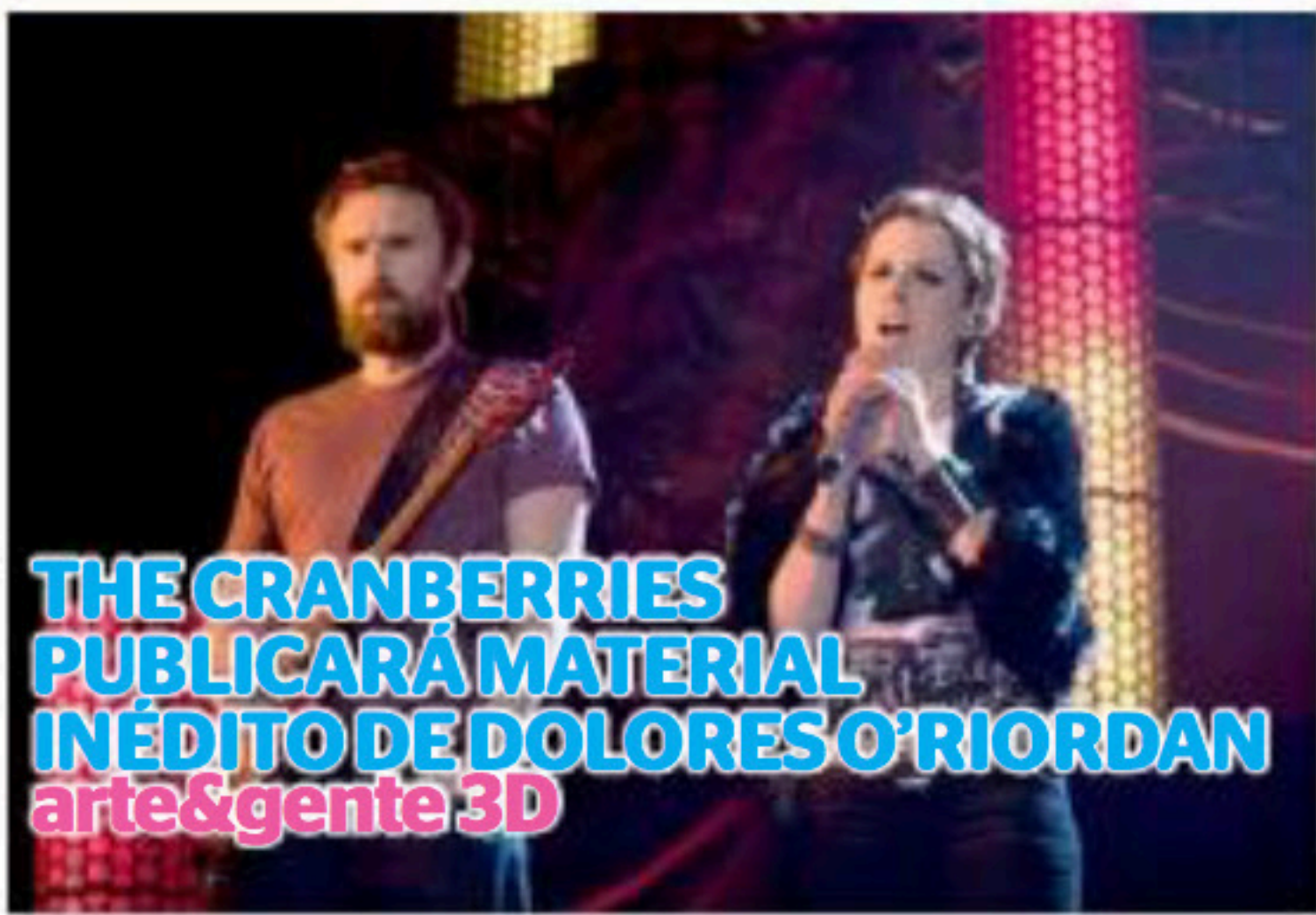
THE CRANBERRIES PUBLICARÁ MATERIAL INÉDITO DE DOLORES O'RIORDAN arte&gente 3D