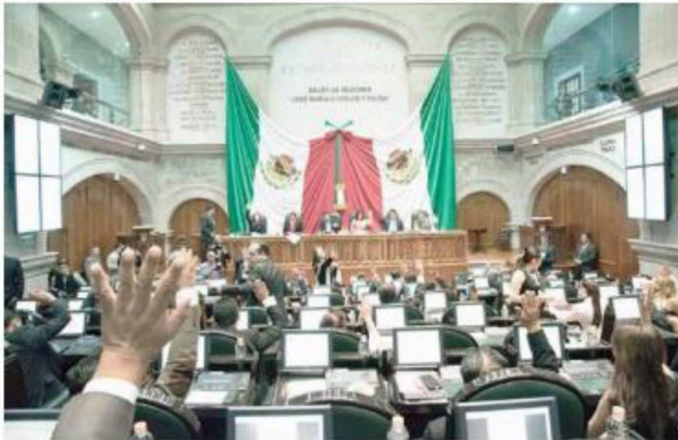
Los diputados mexiquenses recibieron el Plan de Desarrollo 2017-2023 del Ejecutivo.

Asimismo, sostuvo que el impacto de los programas sociales debe ser efectivo y contar con un diagnóstico claro de la problemática, sobre todo de la pobreza.