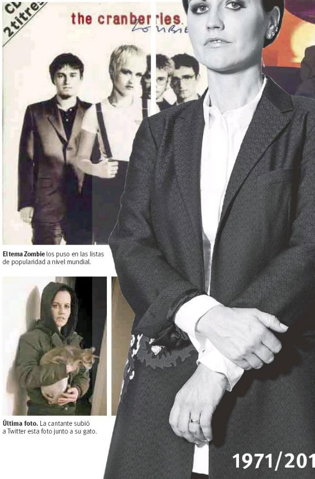
El tema Zombi los puso en las listas de popularidad a nivel mundial.