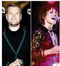
Fan. "Tenía una voz y presencia maravillosas": James Corden.

"Conocí a Dolores O'Riordan cuando tenía 15 años. Era amable y encantadora, me dio su autógrafo en mi boleto de tren, y eso me hizo el día".