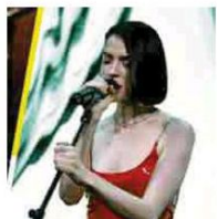
Música. La cantante St. Vincent es una de las cartas fuertes.

Al realizarse el 7 de abril, Ceremonia será una opción aparte del festival Corona Capital de Guadalajara. El Universal