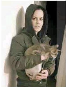
Última foto. La cantante subió a Twitter esta foto junto a su gato.