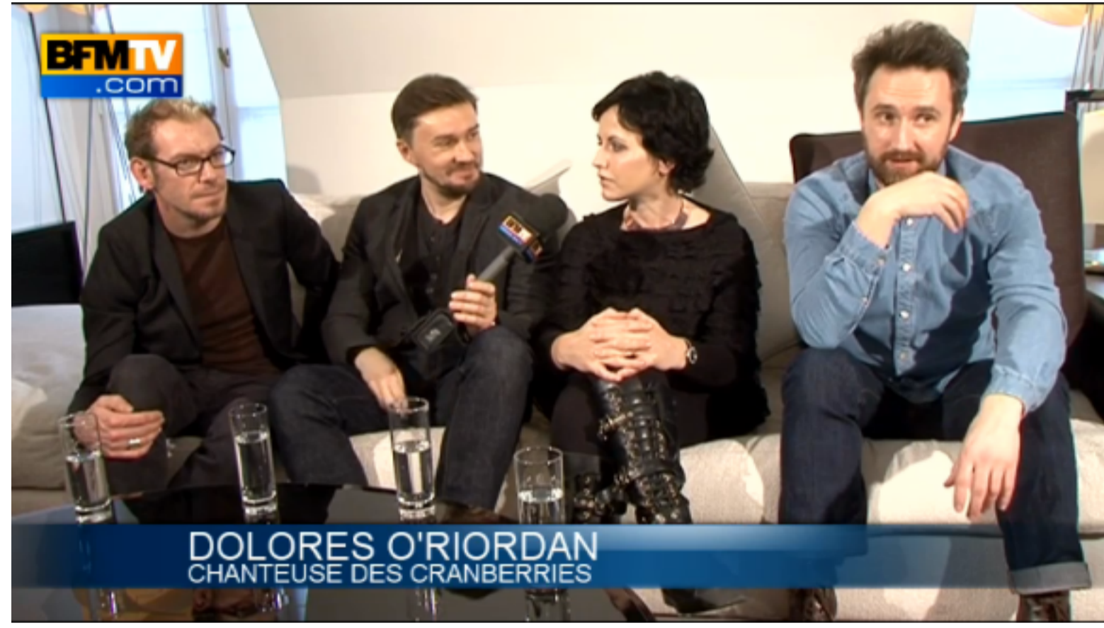
DOLORES O'RIORDAN CHANTEUSE DES CRANBERRIES