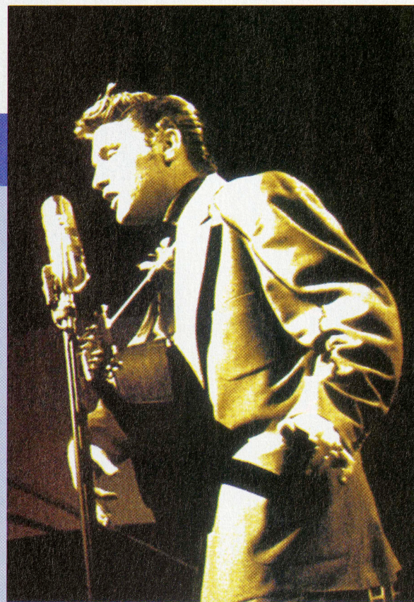
Elvis Presley '30 # 1 Hits' RCA