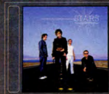
STARS, THE BEST OF 1992-2002 Universal ***

Un best of est toujours un disque difficile à appréhender. Il confronte différents passages de la vie d'un artiste et donc différentes façons de concevoir la musique. Celui de Cranberries ne fait pas défaut à la règle. Proposé dans l'ordre chronologique de leur création, il évoque d'abord le souvenir avec les mélodies ravissantes de Dreams et Linger . On plonge ensuite dans l'énorme succès de Zombie ou Ode To My Family , morceaux d'une simplicité déconcertante mais à l'efficacité maximale. Ensuite, changement de cap, le ton devient un peu plus dur et les nuances plus rares. Les tubes, pourtant, continuent de défiler, Salvation , Free To Decide , Hollywood , Promises , Animal Instinct , Analyse . On en avait oublié certains mais en effet, depuis dix ans, les Cranberries sont parvenus à chaque album à imposer un single calibré. En bonus, comme c'est la règle maintenant, deux inédits. Stars et New New York . Histoire que les fans, qui possèdent déjà tous les albums, se ruent également sur ce best of. Un résumé honnête de dix ans de carrière.