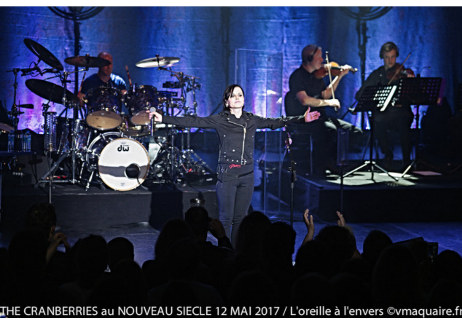
THE CRANBERRIES au NOUVEAU SIECLE 12 MAI 2017 / L'oreille à l'envers